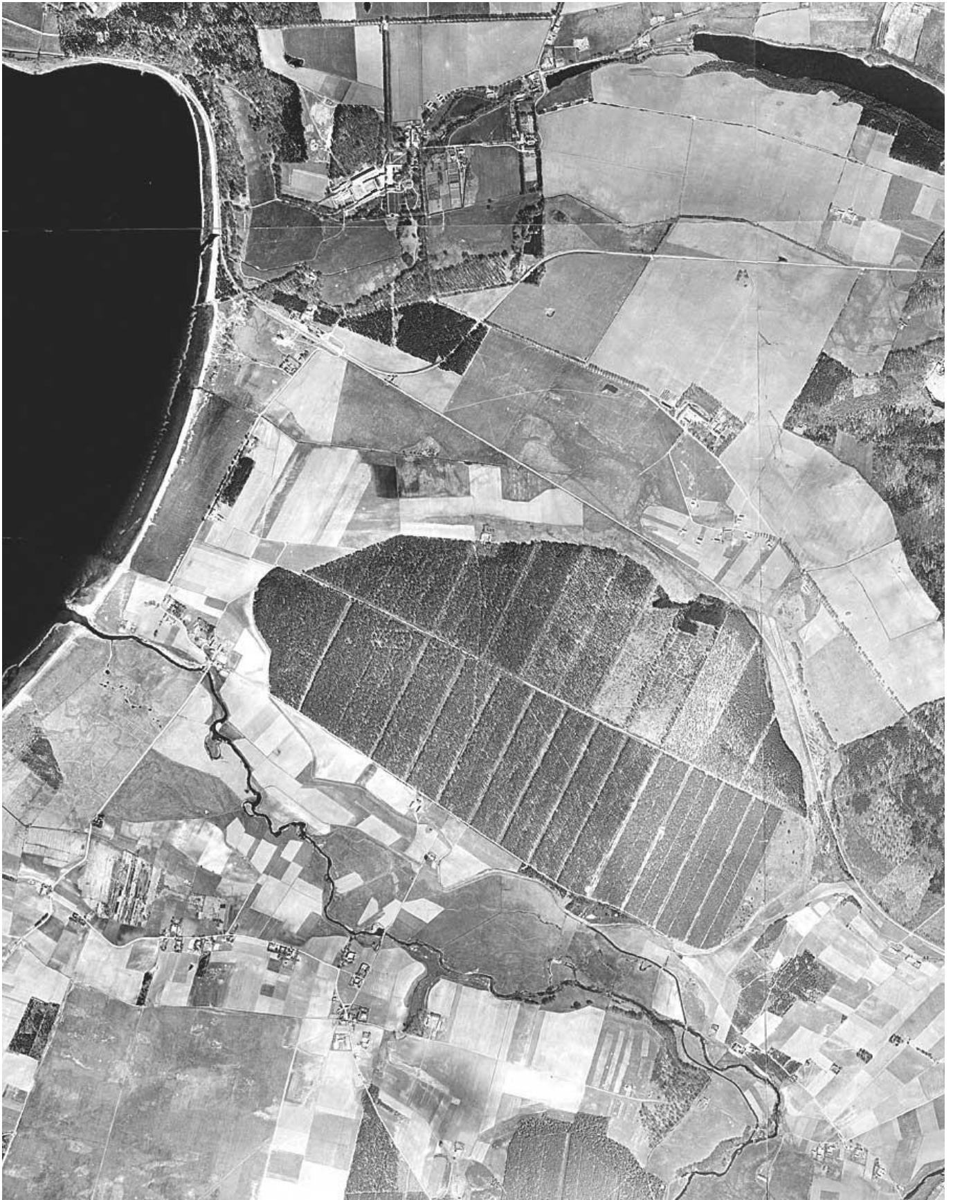
Öved, Vressel, Björka