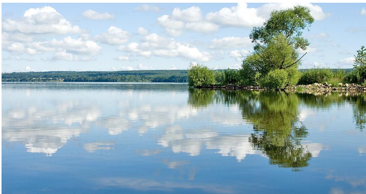
Vombsjön vid Björkaåns mynning

Vombsjön, Björkaån och Björkadammen erbjuder många fritidsfiskare ett roande och ibland även givande nöje.