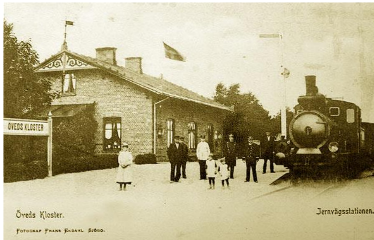
Övedskloster, senare Klostersågen.